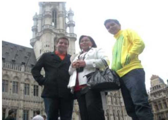
GRUPO, EN LA GRAN PLAZA, EN EL CENTRO DE LA CIUDAD

En la estadía en Bruselas, Bélgica, el grupo se alojó en el hotel Scandinavia, el cual se sitúa en un sector donde predominan las familias árabes y la mayoría son musulmanes.