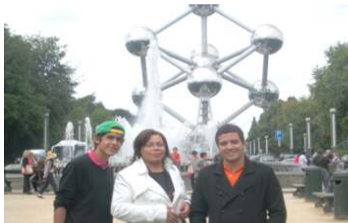
Foto del grupo mientras paseaba por el parque central