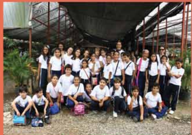
Los estudiantes de 4to de Básica durante el recorrido.

Yo recién inicio este año como madre en el San Judas Tadeo y este paseo es mi primera experiencia con todos los chicos. Lo primero que me llamó la atención fue que siendo un grupo de 60 y tantos niñas y niños, su comportamiento fue ejemplar. Los Chicos llegaron a Orchidom, ya con preguntas previamente elaboradas por su maestra, lo que incentivó a la atención y orden durante la explicación del proceso.