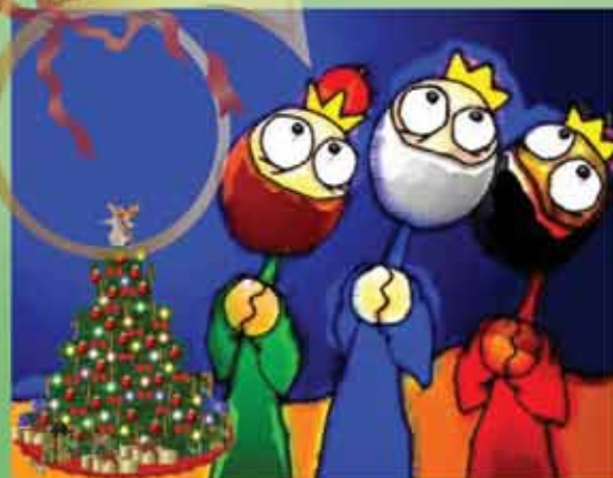
Los Reyes Magos

La costumbre del árbol de Navidad nació en Alemania, en la primera mitad del siglo VIII. Estaba predicando el misionero británico San Bonifacio un sermón, el día de Navidad, a unos druidas alemanes para convencerles de que el roble no era un árbol sagrado. Cortó un roble y ese tiró a otro así hasta que cayeron todos, menos un abeto al que le llamaron árbol del niño Jesús.